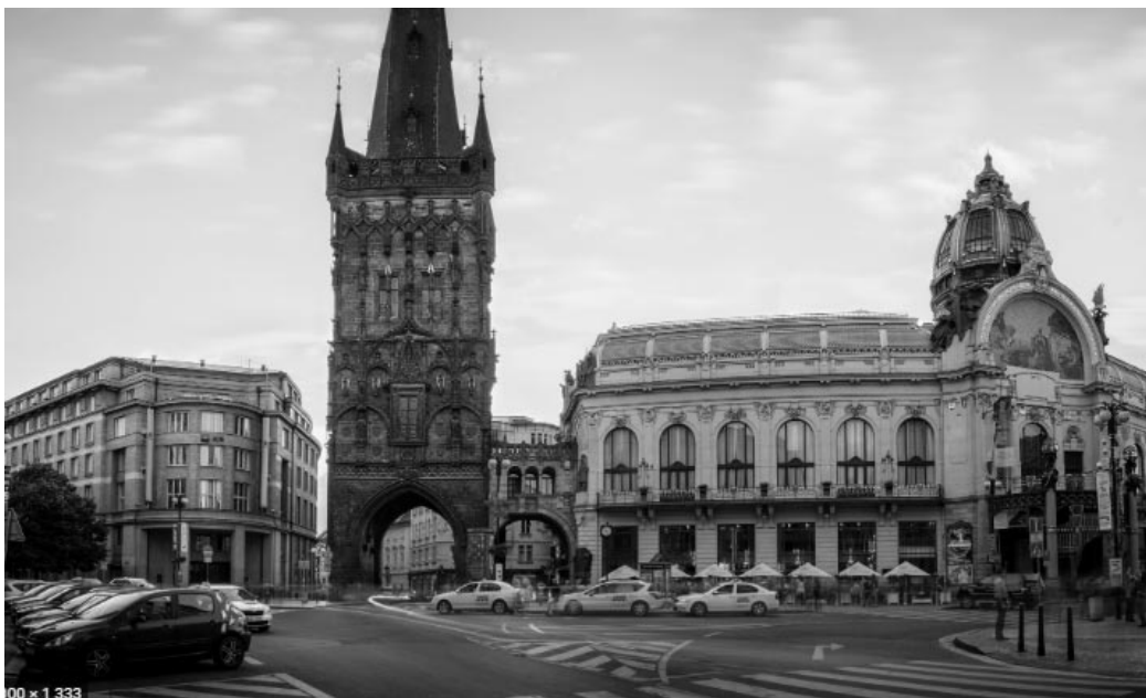
Prašná brána, současný stav.

1 Porovnejte snímek ze současné Prahy s plány na přestavbu od nacistických architektů. Vyznačte rozdíly tužkou do fotografií.