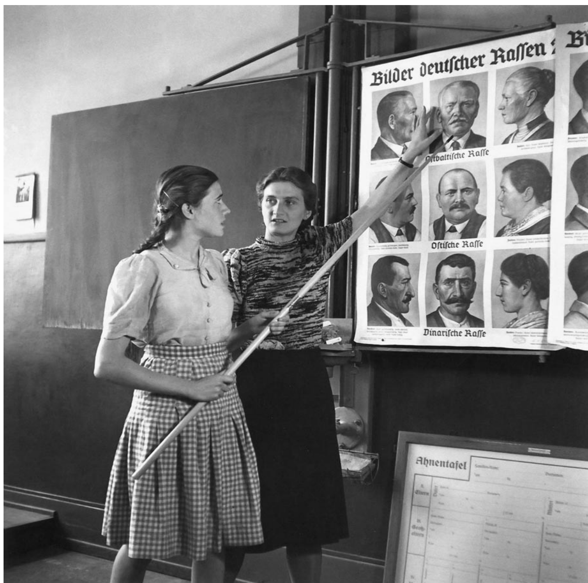
Výuka o německé rase v dívčí škole, 1943.